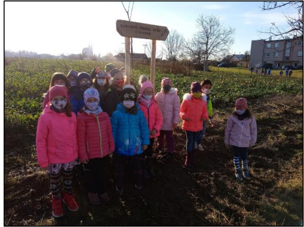
24.11.2020 – Sázání stromů