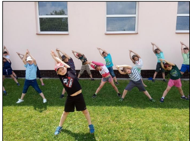
Červen – Jóga ve družině