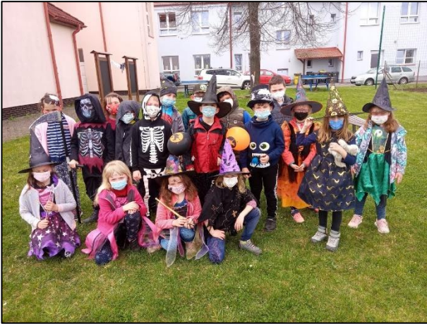
29.04.2021 – Čarodějnický sabat