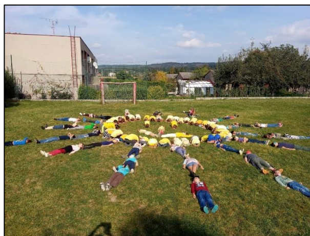
23.09.2021 – Sluníčkový den