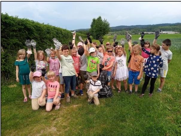
10.06.2021 – Uklízíme Česko