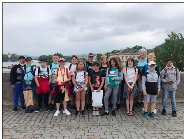
Třídní výlet do Prahy