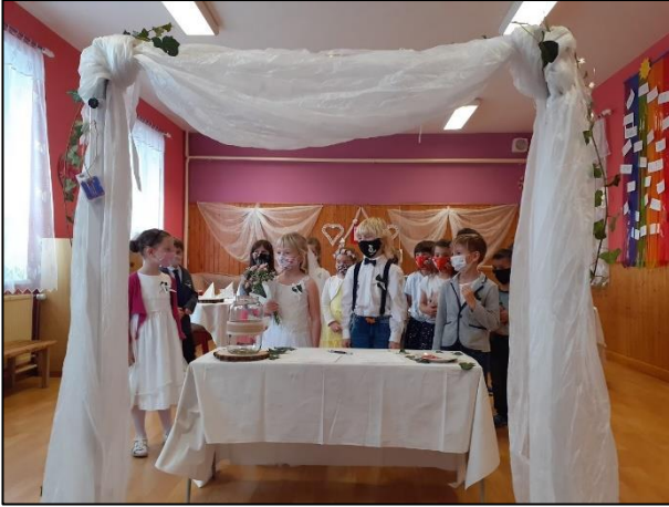
27.01.2021 – Svatba ve družině