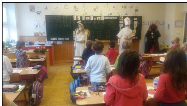
Mikuláš na I. stupni