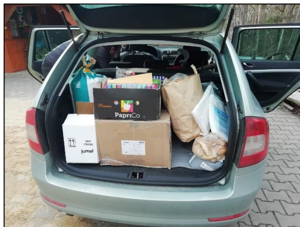
Dary pro Záchranou stanici Pasíčka