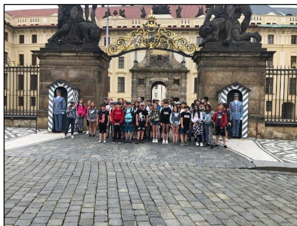
Třídní výlet do Prahy