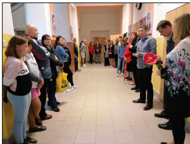
Slavnostní otevření PC učebny