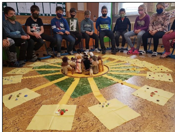
Poselství Vánoc – I. stupeň