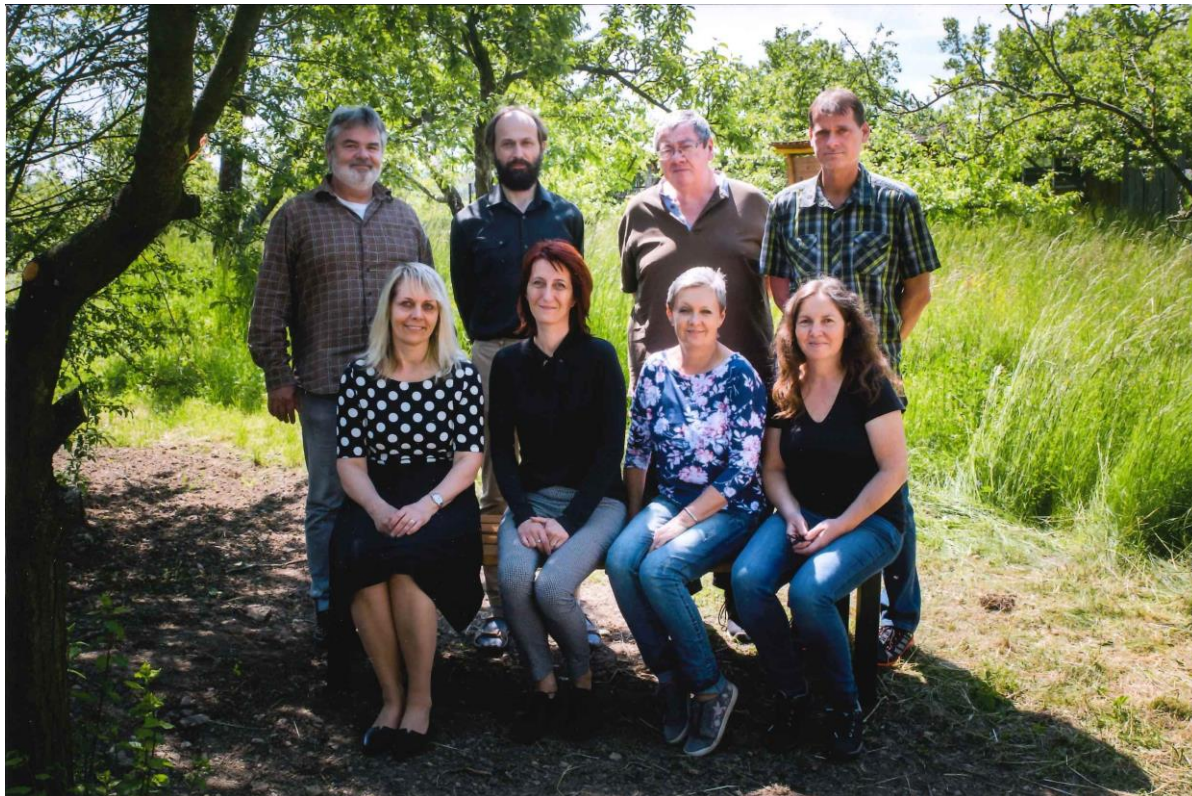
pedagogové 2. stupně