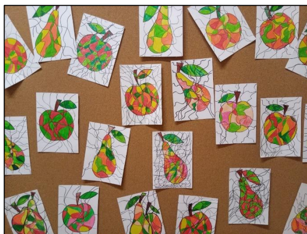
Podzimní tvoření - ukázka