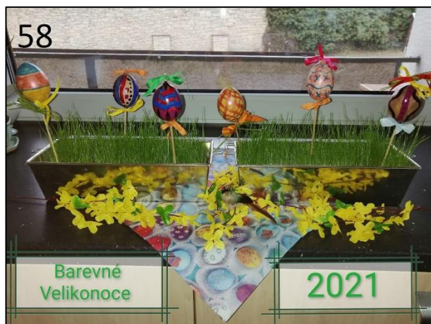
Soutěž Barevné Velikonoce na I. stupni