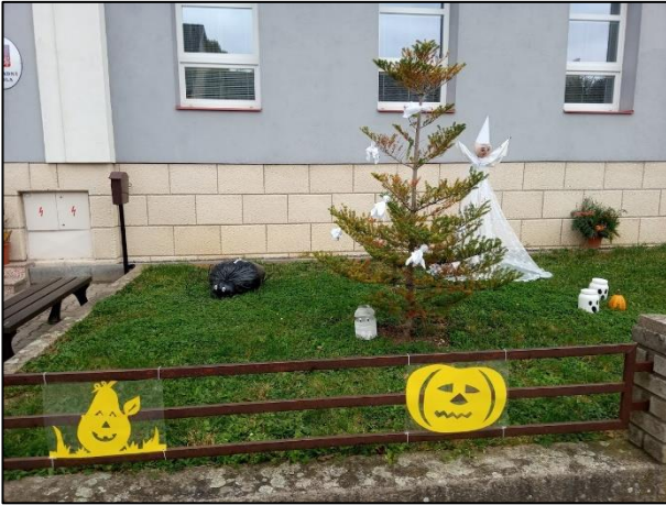
listopad 2020 - Strašidelná zahrádka