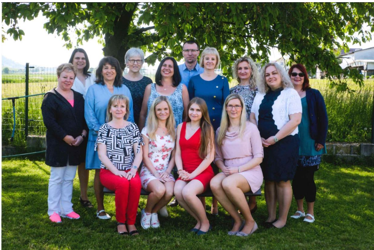
pedagogové 1. stupně