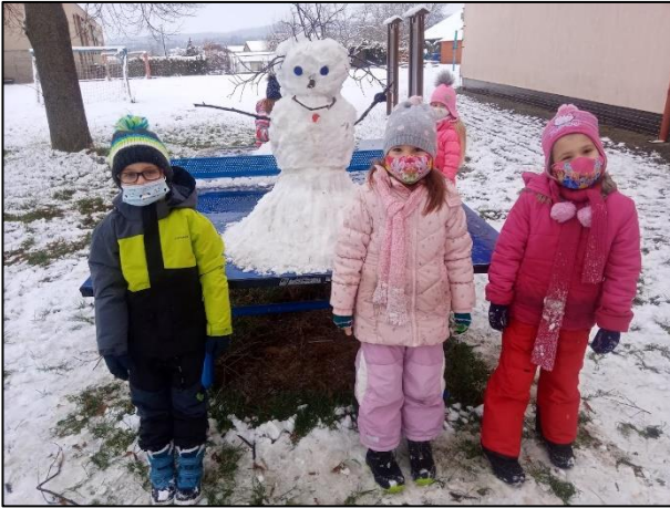
leden 2021 – Hry na sněhu